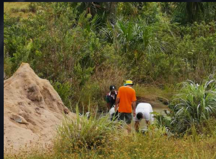
2019年3月,巴西矿业协会(ASBM)地质学家团队在亚马逊区域某矿区工作并与当地孩子们。