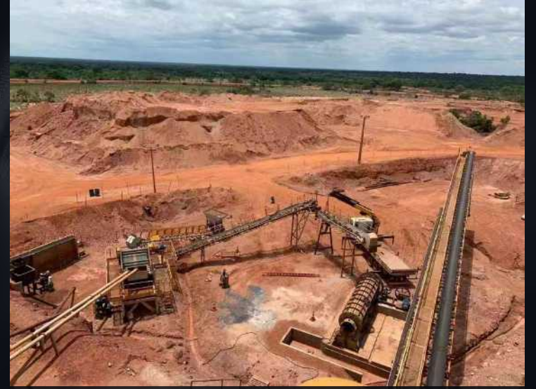
2019年11月，中国某金矿企业在巴西马托格罗索州勘察金矿。