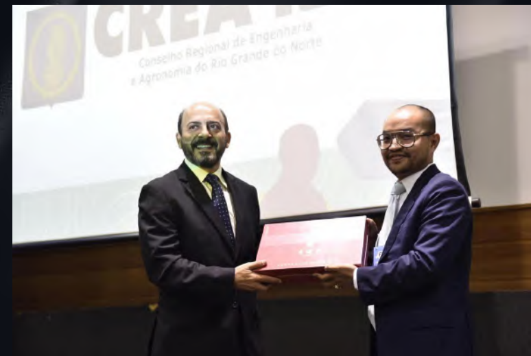
2019年11月28日，巴西中国矿业协会(ASBM)受邀参加2019巴西国家矿业论坛。