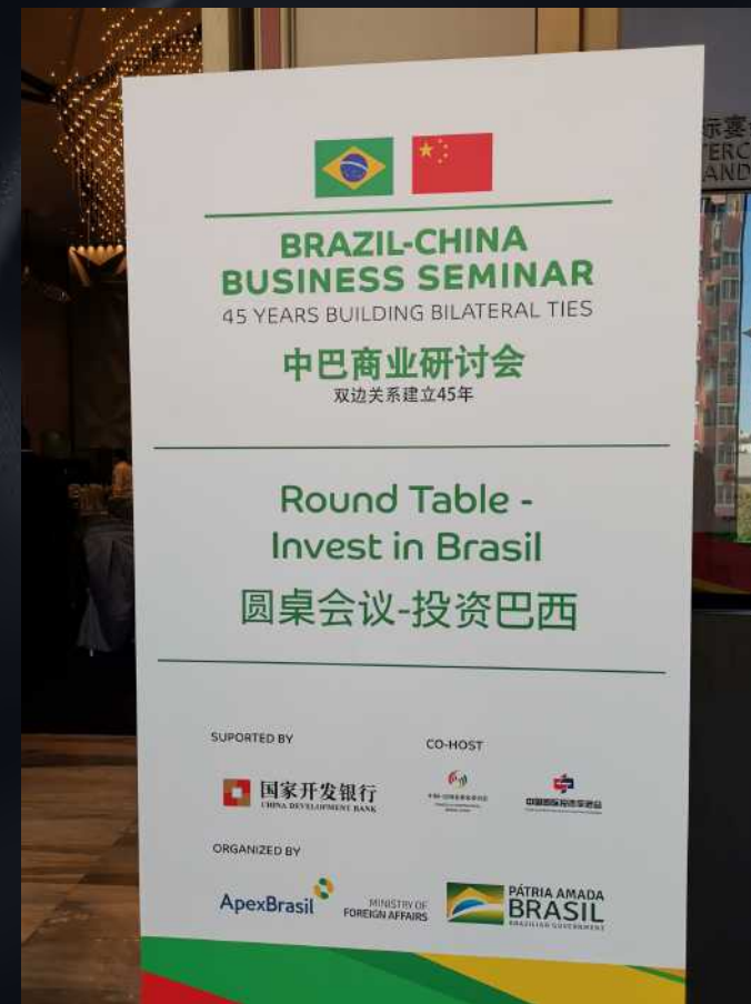
2019年10月25日中国 - 巴西经贸合作论坛在北京举行。中国国家副总理胡春华与巴西总统博索纳罗共同出席开幕式并致辞，中国与巴西200名企业家参加了论坛。