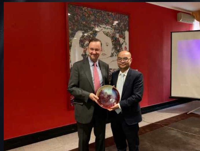
2019年10月22日，巴西总统博索纳罗访华期间，巴西矿产能源部(ANM)部长 Bento Costa 与巴西驻华大使保罗·瓦莱在巴西大使馆接见巴西中国矿业协会（ASBM）代表团。