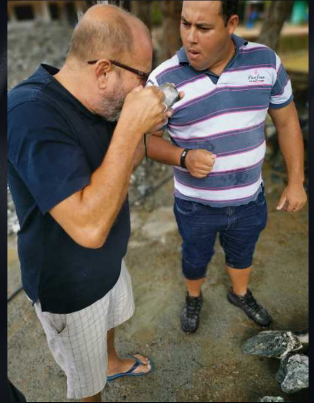
2019年2月，巴西中国矿业协会(ASBM)在巴西戈亚斯州某祖母绿矿区考察并与巴西祖母绿地质学家交流。