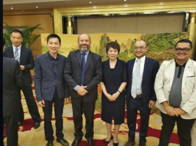
2019年5月29日，河北省副省长夏延军接待了来访的巴西戈亚斯州副州长林肯一行15人，就深化两省州友好关系，推动双方在畜牧业、矿业、化工、医药等领域的交流合作达成多项共识。