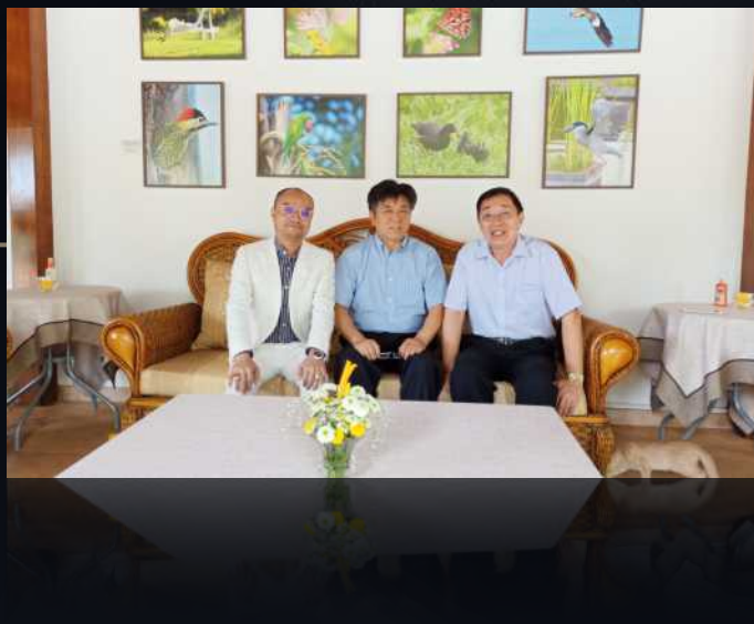
中华人民共和国驻巴西大使李金章在巴西大使官邸接见CHEN JUN先生。