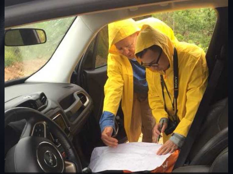
2019年4月，中国地质科学院地质学家和巴西地质学家在巴西中部某稀有矿区勘察。