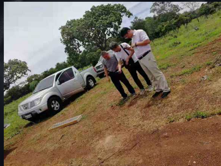
2019年11月，中国某金矿企业在巴西中部一个重要金矿公司考察。